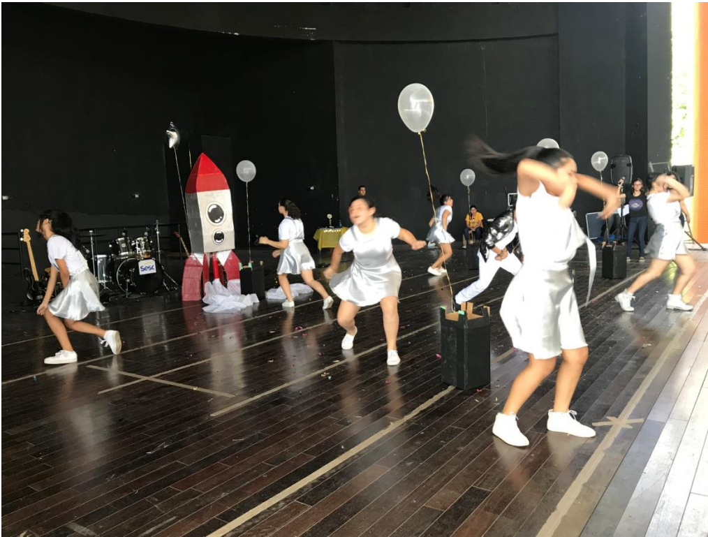
Figura 2: Sesc Music Festival, ano do tema “ Boy bands ”.