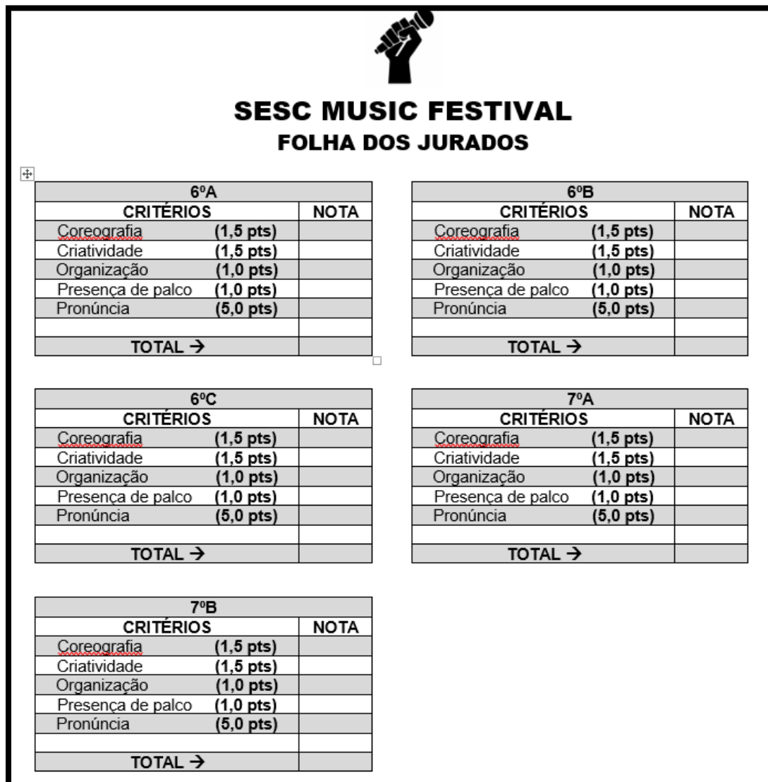
Figura 10: Modelo de avaliação da culminância do projeto