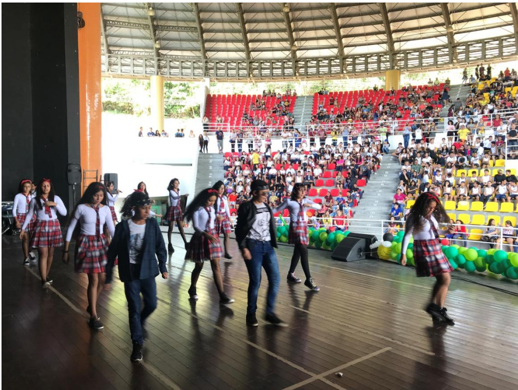
Figura 1: Sesc Music Festival, ano do tema “ Boy bands ”.

https://drive.google.com/drive/folders/1U6alE0KEKnYB1-2SiiypTA8zf7ds39wT?usp=drive_link