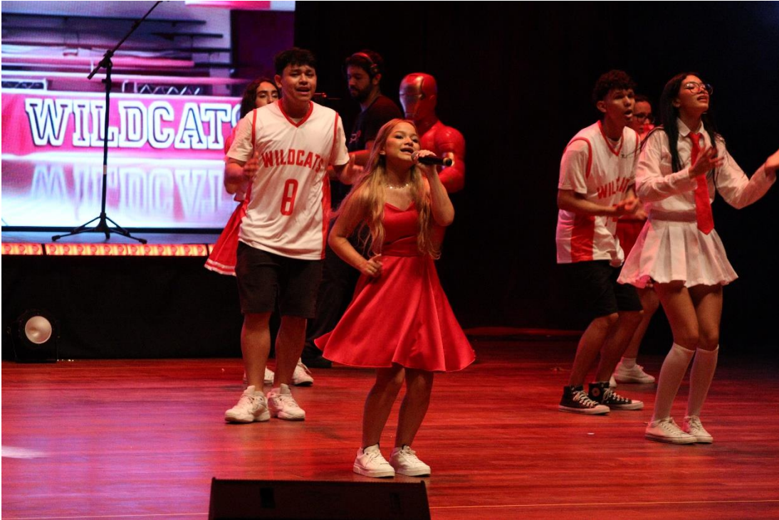
Figura 6: Sesc Music Festival, ano do tema “Disney Dream”.