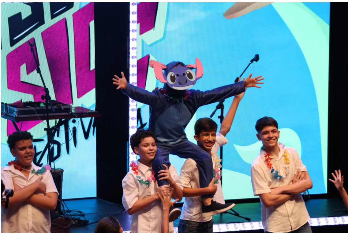
Figura 9: Sesc Music Festival, ano do tema “Disney Dream”.