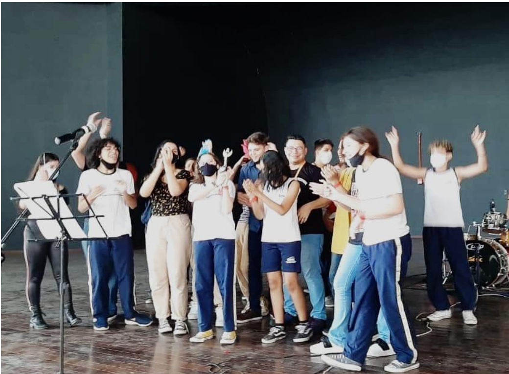
Figura 3: Sesc Music Festival, ano do tema “ Sucessos dos anos 2000 a 2013 ”.