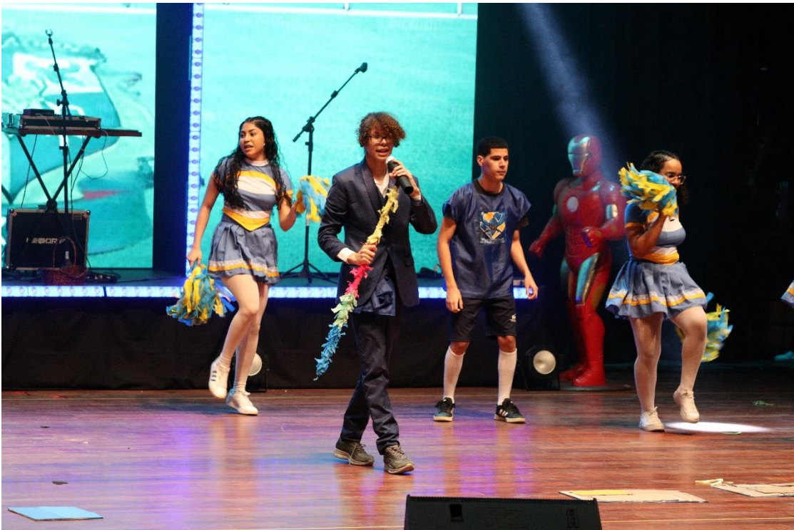
Figura 7: Sesc Music Festival, ano do tema “Disney Dream”.