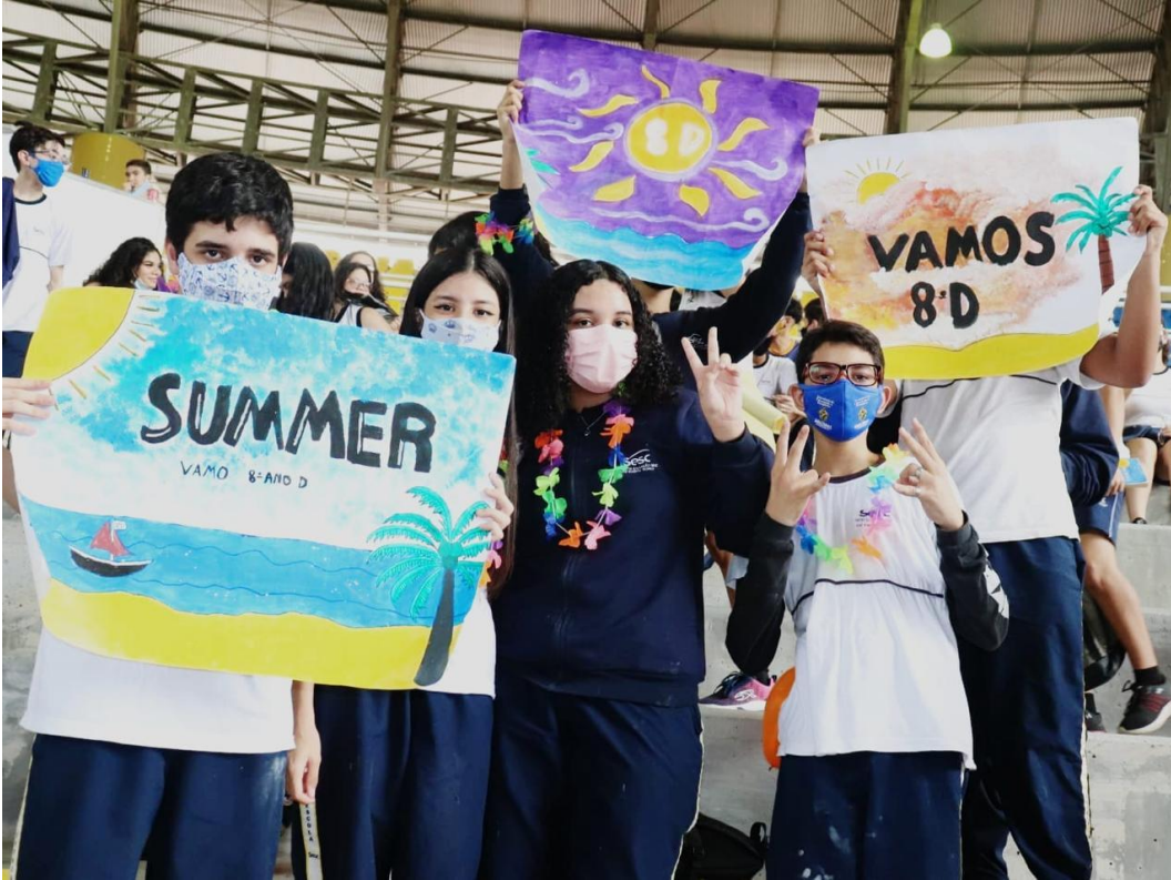
Figura 4: Sesc Music Festival, ano do tema “Sucessos dos anos 2000 a 2013”.