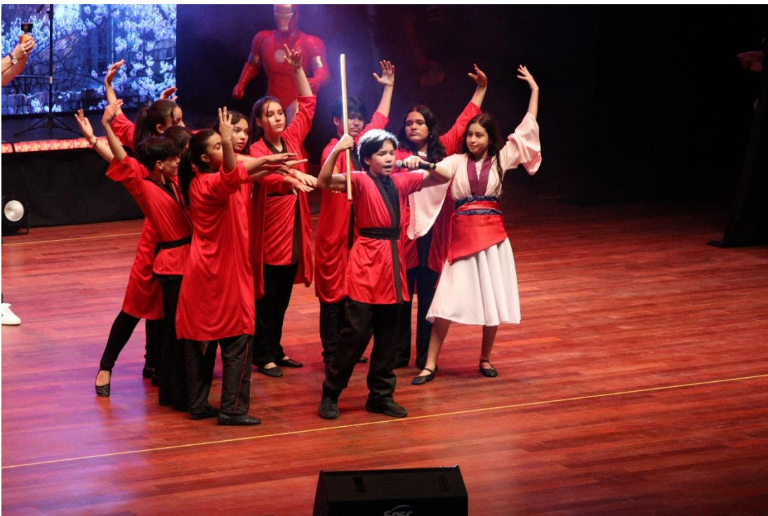
Figura 5: Sesc Music Festival, ano do tema “Disney Dream”.