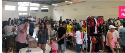
01/05 – Dia do Trabalho NSC TV Globo (tarde/noite)